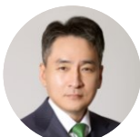
Consumer & Retail